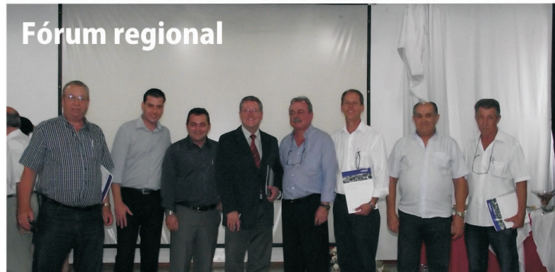
O Fórum Regional do Emprego reuniu 15 cidades da região, no dia 27/03, no Anfiteatro Municipal