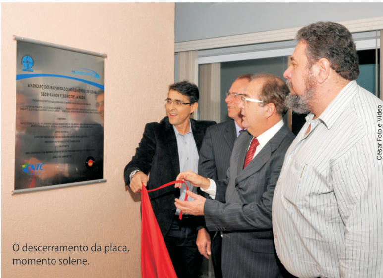
O descerramento da placa, momento solene.

O Sindicato dos Comerciantes inaugurou no dia 27 de junho a sua nova sede na cidade de Leme, um antigo projeto da diretoria para melhor atender a cerca de 3500 comerciantes da cidade. Batizada como "Ramon Ribeiro de Arruda", a nova sede foi inaugurada em cerimônia que atraiu autoridades, sindicalistas, comerciantes e outros convidados, que ficaram deslumbrados com as novas e modernas instalações à Rua Coronel José Leme Franco, 563.