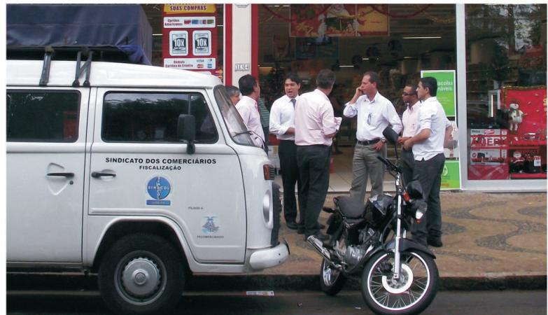
Em porta de loja, diretores e colaboradores do Sinicol protestam em defesa dos comerciários.