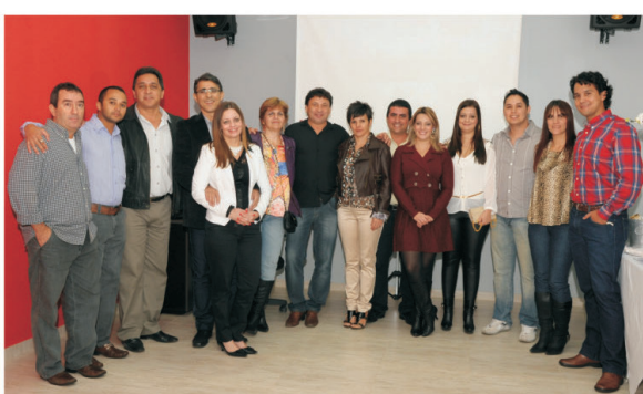
Amigos, sindicalistas e familiares confraternizam com o homenageado.