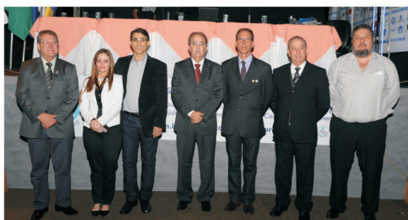
A mesa de autoridades contou com nomes ilustres.