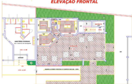
PLANTA DO PAV. TÉRREO