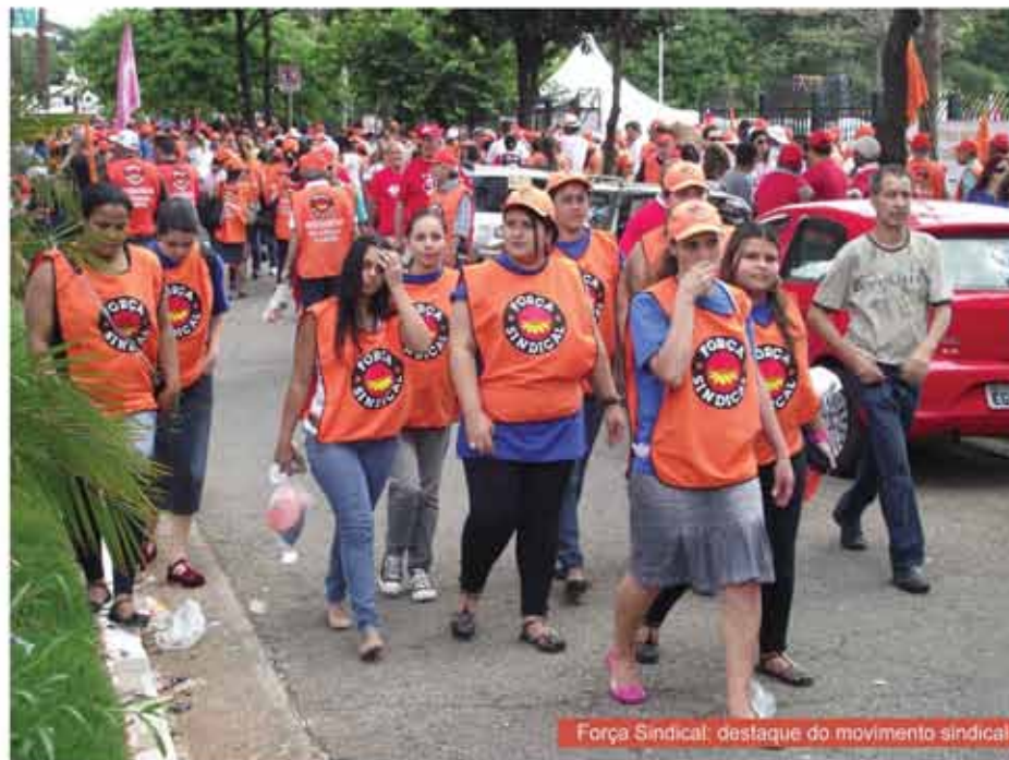
Força Sindical, destaque do movimento sindical