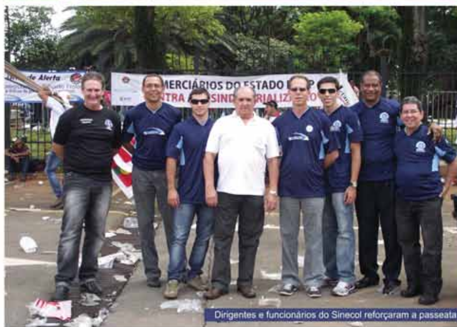
Dirigentes e funcionários do Sinecol reforçaram a passeata