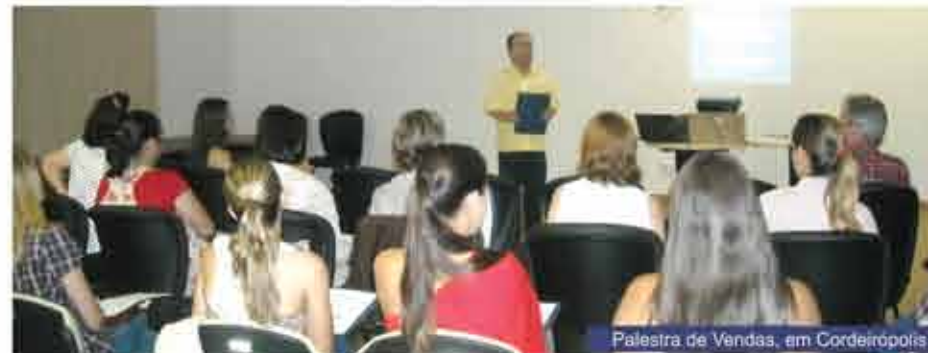
Palestra de Vendas, em Cordeirópolis

princípios aos comerciários mais experimentados. Os cursos e palestras acontecem das 19h30 às 22h00. São apenas 25 vagas para cada evento e as inscrições já podem ser feitas na sede do Sinecol (Limeira e Araras). Na cidade de Cordeirópolis, as inscrições são feitas na Sede da Associação Comercial (Aciaç).